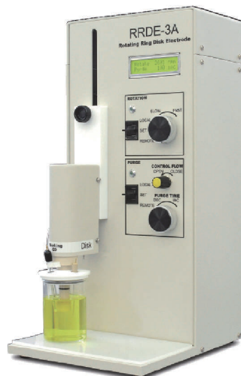
RRDE-3A 回転リングディスク電極装置 Ver.2.0