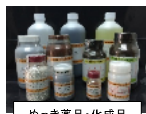
めっき薬品・化成品