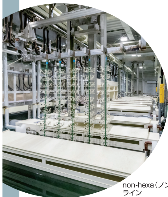
non-hexa (ノンヘキサ) ライン

今やものづくりに欠かせない技術となったプラスチックめっき。私たちはめっき専門メーカーとして、これからもプラスチックめっきの新たな可能性を追求し、次世代を見据えた新しい技術のご提供をつづけていきます。